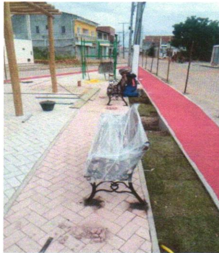
Foto 11 - Banco de madeira com encosto em eucalipto tratado (2,00X0,50)M