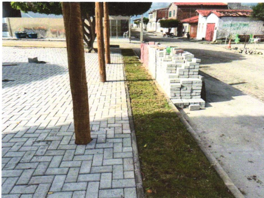
Foto 10 - Grama esmeralda em placas, fornecimento e plantio