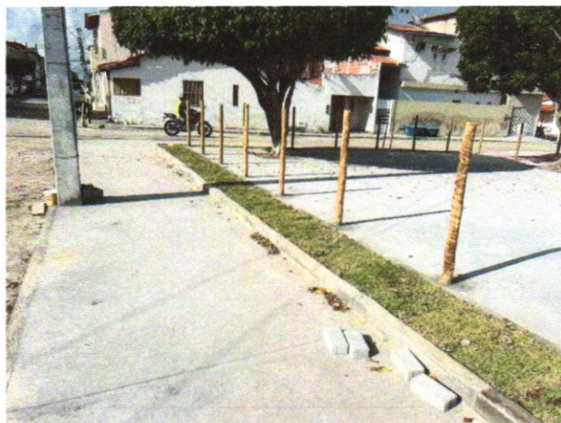
Foto 02 PAVIMENTAÇÃO EM CONCRETO, COM ESPESSURA DE 7 CM, COM ACABAMENTO FEITO UTILIZANDO ALISADORA DE CONCRETO (HELICOPTERO), INCLUIDO TELA DE AÇO SOLDADA NERVURADA CA60, Q196 (3,11 KG/M2), DIAMETRO DO FIO 5.0 MM, LARGURA = 2,45 M, ESPAÇAMENTO DA MALHA = 10 X 10 CM, JUNTA DE DILATAÇÃO EM PVC A CADA 2,00 M, CONCRETO FCK = 20 MPA

Evaldo Almeida Moraes Engenheiro Civil RNP 051417303-3