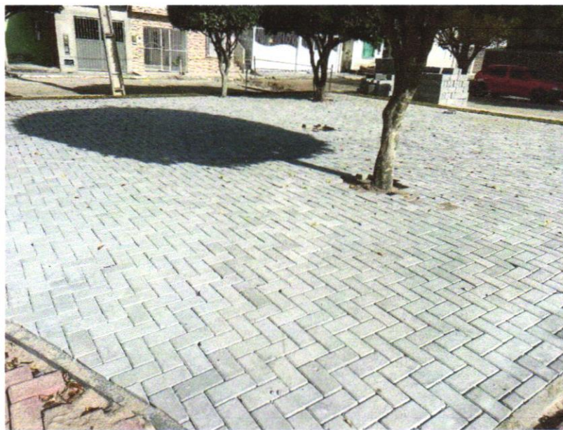
Foto 03 - Pavimentação em bloco de concreto vibroprensado, intertravado, cor natural, 10x20cm, e=6cm, 46un/m 2 , NBR9781, Fck(min)=35MPa, sob coxim areia grossa compactada c/ placa vibratória, e(comp.)=6cm, rejuntado c/ areia fina.