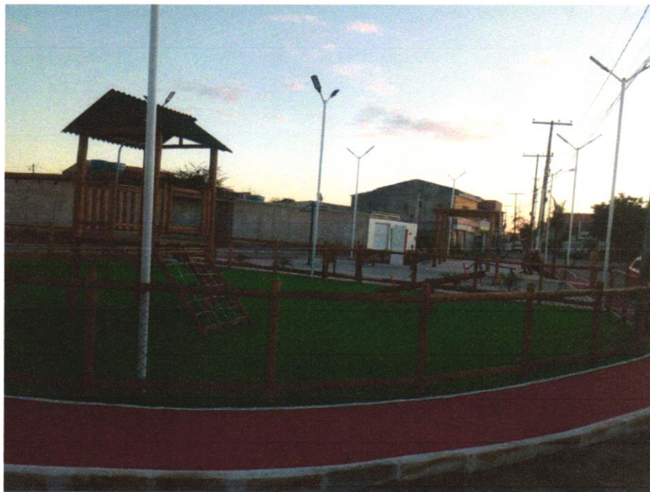
Foto 07 - Fornecimento e assentamento de Casinha do Tarzan em eucalipto tratado, com pórtico de um balanço