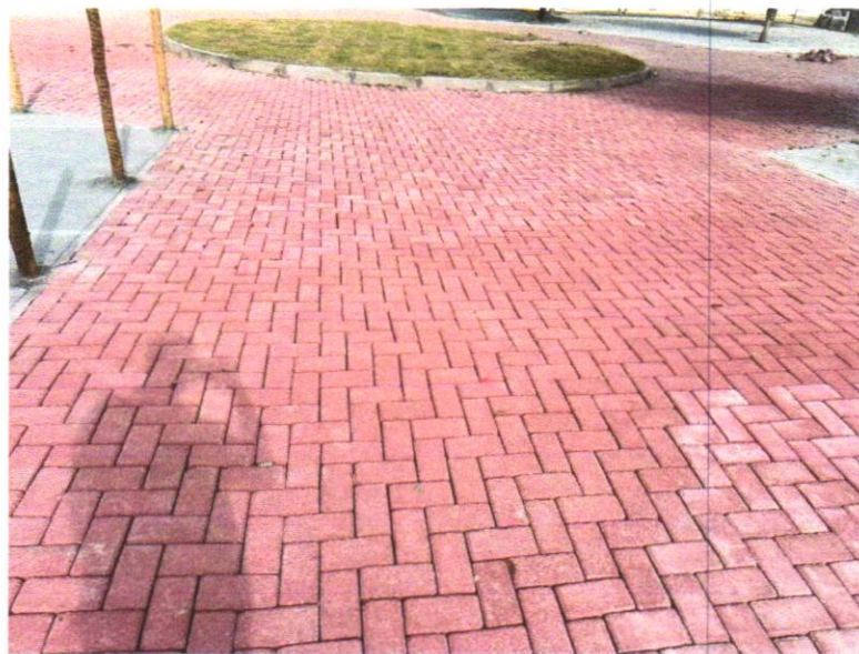
Foto 05 - Pavimentação em bloco de concreto vibroprensado, intertravado, colorido, 10x20cm, e=6cm, 46un/m 2 , NBR9781, Fck(min)=35MPa, sob coxim areia grossa compactada c/ placa vibratória, e(comp.)=6cm, rejuntado c/ areia fina.