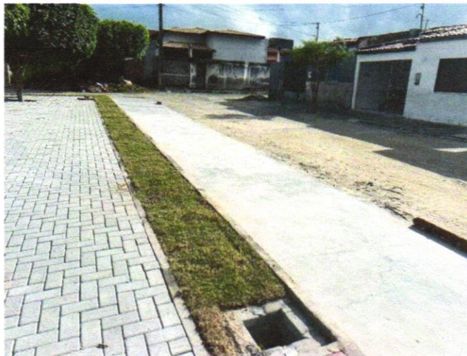
Foto 01 – PAVIMENTAÇÃO EM CONCRETO, COM ESPESSURA DE 7 CM, COM ACABAMENTO FEITO UTILIZANDO ALISADORA DE CONCRETO (HELICOPTERO), INCLUIDO TELA DE AÇO SOLDADA NERVURADA CA60, Q196 (3,11 KG/M2), DIAMETRO DO FIO 5.0 MM, LARGURA = 2,45 M, ESPAÇAMENTO DA MALHA = 10 X 10 CM, JUNTA DE DILATAÇÃO EM PVC A CADA 2,00 M, CONCRETO FCK = 20 MPA