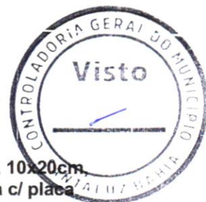
Foto 06 - Pavimentação em bloco de concreto vibroprensado, intertravado, colorido, 10x20cm, e=6cm, 46un/m 2 , NBR9781, Fck(min)=35MPa, sob coxim areia grossa compactada c/ placa vibratória, e(comp.)=6cm, rejuntado c/ areia fina.

Evaldo Almeida Moraes Engenheiro Civil RNP 051417303-3